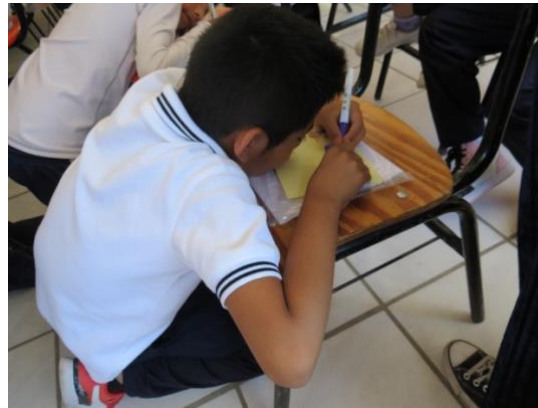
Imagen 9. Carta a Patrimonio Dolores Hidalgo, Guanajuato (julio 2023)

Para el tercer momento del taller, se optó por cambiar la dinámica por el número de niños participantes, y se puso en práctica la Bitácora de Patrimonio , se observó que los niños llegaron a tener dificultades para reconocer los bienes culturales de su ciudad, debido a que los confundían con bienes pertenecientes a otras ciudades; por ejemplo, al preguntar sobre las leyendas de Dolores Hidalgo, inmediatamente hablaron del Callejón del Beso, leyenda de la ciudad de Guanajuato. No obstante, para los niños fue fácil identificar las fiestas cívicas y patronales, así como los monumentos históricos, como patrimonio material al vivir en una ciudad histórica reconocida a nivel nacional e internacional como la Cuna de la Independencia Nacional.