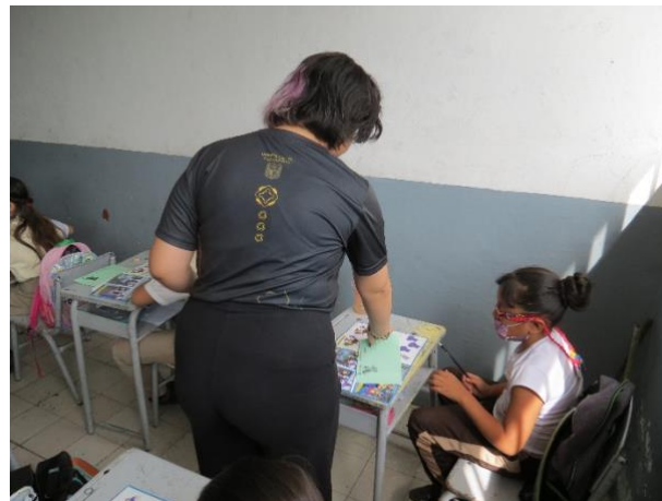
Imagen 6. Carta a Patrimonia Salamanca, Guanajuato (julio 2023)

Después de haber concluido con la lectura de la historieta, se procedió al segundo momento Carta a Patrimonia , se repartieron los formatos de las cartas en donde los niños y niñas deberían de escribir el compromiso que asumen para salvaguardar el patrimonio. La carta de una niña fue muy interesante, ya que mencionó que la destrucción del patrimonio natural o cultural es causado por el propio ser humano . El anterior comentario debe hacernos reflexionar en la capacidad de conocer, identificar, valorar y difundir el patrimonio cultural y artístico con un sentido crítico por parte de los niños y niñas guanajuatenses.