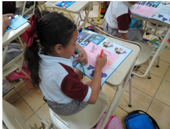
Imagen 2. Carta a Patrimonia León Guanajuato (junio 2023)

Los primeros niños que terminaron de realizar su carta, fueron los elegidos para representar a los personajes de Tertulia de Patrimonia (tercer momento) titulada “ Cuidemos el Patrimonio ”, la cual buscaba hacer énfasis en el cuidado del Templo de San Juan del Coecillo, un bien cultural colindante a este Colegio.