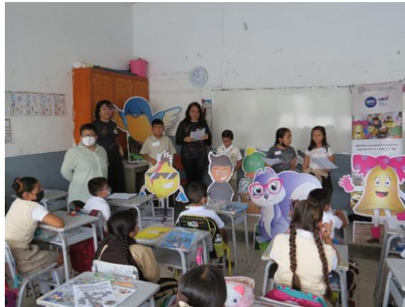
Imagen 7. Tertulia de Patrimonio Salamanca, Guanajuato (julio 2023)

Antes de finalizar el taller, se procedió a tomar una Selfie con todos los integrantes de la historieta y los niños y niñas del tercer año de primaria grupo "A" donde todos felices gritaron al unísono " Salvemos el Patrimonio ".