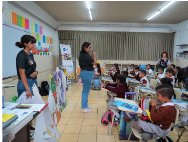
Imagen 1. Colegio Pio XII, León, Guanajuato (junio 2023)

En la realización Carta a Patrimonia (segundo momento), la mayoría de los niños y niñas realizó dibujos referentes al cuidado del Patrimonio Natural, representaron un gran número de paisajes con árboles y flores con letreros como “no cortar” y “no talar”, además de frases como “cuidar el agua” y “tirar la basura en su lugar”. Cabe destacar que, un par de niños hablaron sobre hacerle caso a sus papas y a su maestra.