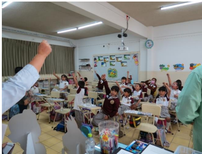
Imagen 4. Selfie ¡Salvemos al Patrimonio! (junio 2023)

Al finalizar el taller los niños estaban muy agradecidos por el momento que habían pasado, sobre todo porque reconocieron los bienes culturales locales, con los cuales conviven de forma cotidiana.