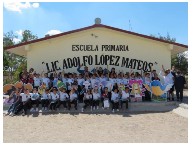
Imagen 10. ¡Salvemos al Patrimonio! Dolores Hidalgo, Guanajuato (julio 2023)

Finalmente, se procedió a tomarse la Selfie con todos los participantes del taller como un testimonio de memoria colectiva y de compromiso adquirido para salvaguardar el patrimonio cultural del Pueblo Mágico de Dolores Hidalgo.