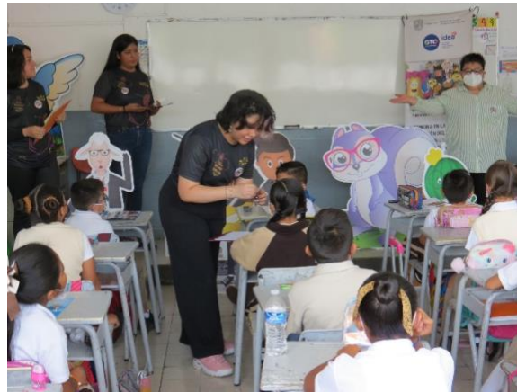
Imagen 5. Escuela Primaria 15 de septiembre Salamanca, Guanajuato (julio 2023)

Después de haber concluido con la lectura de la historieta, se procedió al segundo momento Carta a Patrimonia , se repartieron los formatos de las cartas en donde los niños y niñas deberían de escribir el compromiso que asumen para salvaguardar el patrimonio. La carta de una niña fue muy interesante, ya que mencionó que la destrucción del patrimonio natural o cultural es causado por el propio ser humano . El anterior comentario debe hacernos reflexionar en la capacidad de conocer, identificar, valorar y difundir el patrimonio cultural y artístico con un sentido crítico por parte de los niños y niñas guanajuatenses.