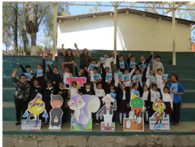
Imagen 14. Construyendo memoria colectiva Guanajuato, Guanajuato (Julio 2023)

Como cierre del taller, se invitó a los 29 niños a tomarse la legendaria Selfie en las canchas de la escuela, espacio que permitió que otros niños y niñas preguntaran ¿Cuándo vienen a nuestro salón de clases? Este interés provoca un compromiso moral y académico de continuar con el proyecto La Liga del Patrimonio visitando los Pueblos Mágicos del Estado de Guanajuato.