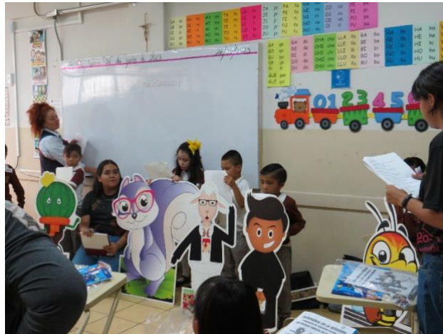
Imagen 3. Tertulia de Patrimonia León, Guanajuato (junio 2023)

Al finalizar el taller los niños estaban muy agradecidos por el momento que habían pasado, sobre todo porque reconocieron los bienes culturales locales, con los cuales conviven de forma cotidiana.