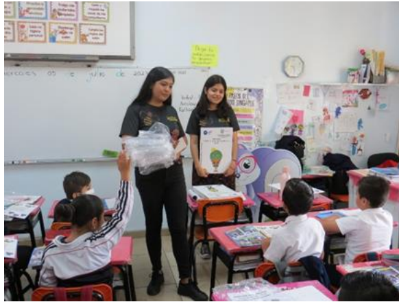
Imagen 13. Bitácora de Patrimonia Guanajuato, Guanajuato (Julio 2023)

En la realización del tercer momento del Taller de mapeo colectivo de patrimonios culturales locales se optó por utilizar la Bitácora de Patrimonia, para aprovechar la participación del grupo y lograr mantener su interés en el tema de Patrimonio. Fue impresionante la manera en que los niños y niñas demostraron en cada participación tener conocimiento empírico del tema, sin necesariamente conocer el concepto académico de patrimonio. El taller provocó un gran sentido de pertenencia en cada uno de los niños, debido a que muchos de sus comentarios aportados tenían relación con sus costumbres familiares, anécdotas, por ejemplo, el consejo para “curar” los molcajetes, así como el proceso de elaboración de instrumentos artesanales, o experiencias de viajes a diferentes pueblos mágicos.