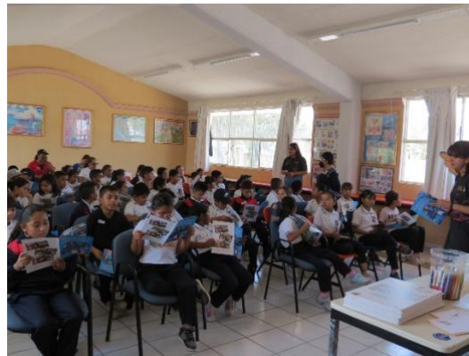
Imagen 8. Escuela Primaria Lic. Adolfo López Mateos Dolores Hidalgo, Guanajuato (julio 2023)

En el Taller de Mapeo participaron 47 niños de 3er grado de Primaria de los grupos "A" y "B", donde se observó el interés de participar y demostrar todo su conocimiento sobre el patrimonio, aunque hubo quienes por timidez tuvieron la dificultad de hacerlo. Cabe destacar que tuvimos la presencia de madres de familia, quienes también estaban emocionadas de compartir sus conocimientos en caso de que los niños no supieran. Durante la lectura de la historieta, se pudo notar el buen reconocimiento que tenían los niños hacia la representación de cada uno de los integrantes de la Liga del Patrimonio y los nuevos amigos, por ejemplo el personaje de Molli, fue rápidamente identificado como el molcajete y relacionado con el Pueblo Mágico que representa, Comonfort. Además, fueron capaces de identificar elementos importantes del Patrimonio cultural tangible e intangible de cada uno de los Pueblos Mágicos abordados durante la lectura (principalmente la comida). Fue sorprendente que una de las niñas explicó de manera detallada la realización de las tortillas ceremoniales de Comonfort, y claro, qué decir de las nieves típicas de su ciudad, contaron los sabores más raros que han probado. Aunque, hubo un par de elementos que no fueron fáciles de ubicar, como el Caldo Michi, comida típica de Yuriria, los niños se imaginaron que se trataba de caldo de gato, pero no es así, es un caldo de pescado con bigotes, de ahí el origen del nombre.