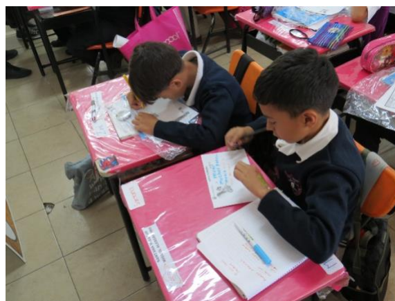
Imagen 12. Carta a Patrimonia Guanajuato, Guanajuato (Julio 2023)

Los resultados del segundo momento denominado Carta a Patrimonia fueron interesantes y se corroboró que por la cercanía cotidiana con el Patrimonio material, inmaterial y natural existente en una ciudad declarada Patrimonio Cultural de la Humanidad como la ciudad de Guanajuato los niños tienen mayor conocimiento del tema. Los niños y las niñas expresaron en sus cartas: "... yo me comprometo a visitar más museos", "¿Cuántos pueblos mágicos hay en México?", "... prometo visitar a Lola la campana", "¿para qué sirve el Patrimonio? ¡Me gustó mucho Membrillong, comeré mucho dulce de membrillo!", "Yo me comprometo a ayudar a mi mamá y visitar el Pueblo Mágico de Mineral de Pozos para saludar a Biznaga.