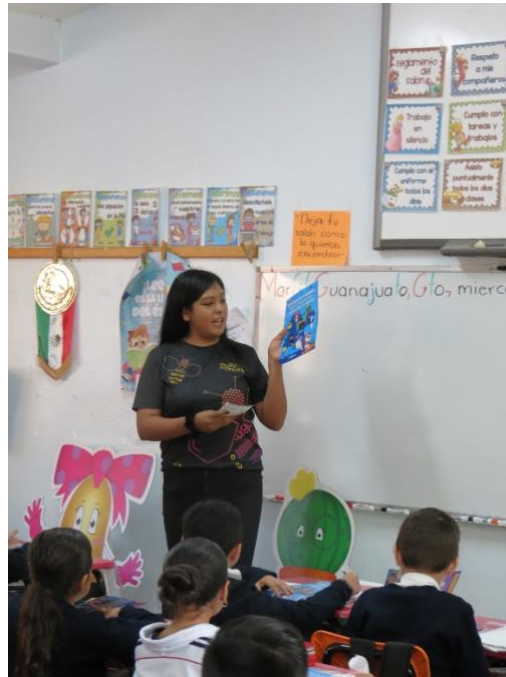
Imagen 11. Escuela Primaria Gral. Sostenes Rocha Guanajuato, Guanajuato (julio 2023)

En la mayoría de los niños y niñas provocó nostalgia el hecho de conocer cómo se encuentran actualmente los patrimonios naturales, sobre todo al enterarse que, en el Pueblo Mágico de Salvatierra, Patrimonia junto con Chusito y UGenia visitan a su amigo Sabino (un pájaro simpático) y al llevarlos a conocer el Ecoparque Sabinal menciona su preocupación por que pronto se quedará sin hogar debido a la tala de árboles en el Puente de Batanes. Por otro lado, los niños y las niñas participaron dando ejemplos de Patrimonio natural de su municipio, identificando fácilmente este tipo de patrimonio, así como su compromiso de cuidar de él.