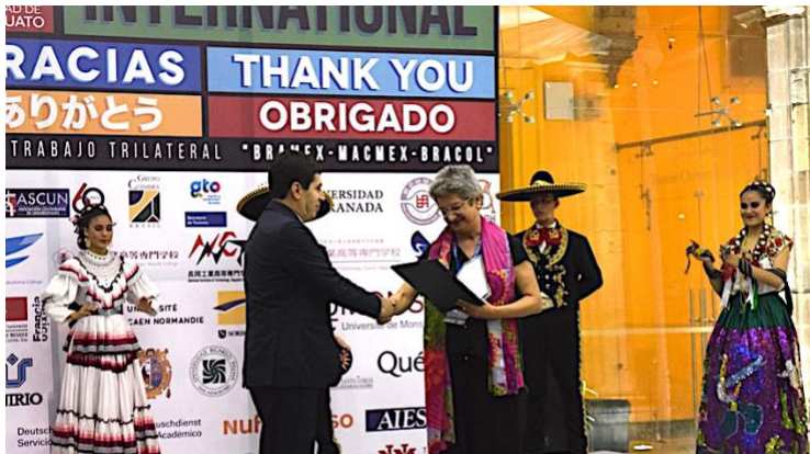
Ilustración 5: Reconocimiento por 22 años de colaboración académica, científica y cultural entre la UG y la Universidad de Granada, España, septiembre 2017

“La internacionalización en el estudiante de arquitectura de la UG: El impacto en su desempeño académico y profesional.”