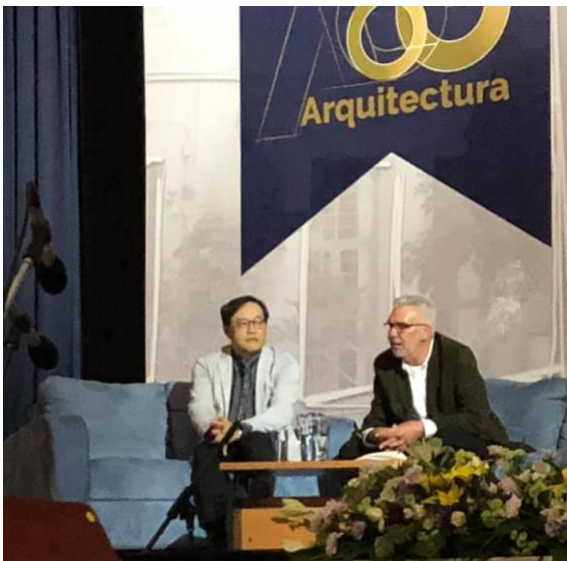
Ilustración 25 Conferencia Arquitecto Satoshi Okada "La intensidad de la arquitectura: Filosofía de diseño y su obra", Velia Ordaz, 03 de octubre de 2019

Puede ser que, al igual que la movilidad internacional presente ciertas barreras, además del idioma, la poca empatía con la actividad siendo que los conocimientos y experiencias se vierten de manera local, la participación estudiantil suele ser baja.